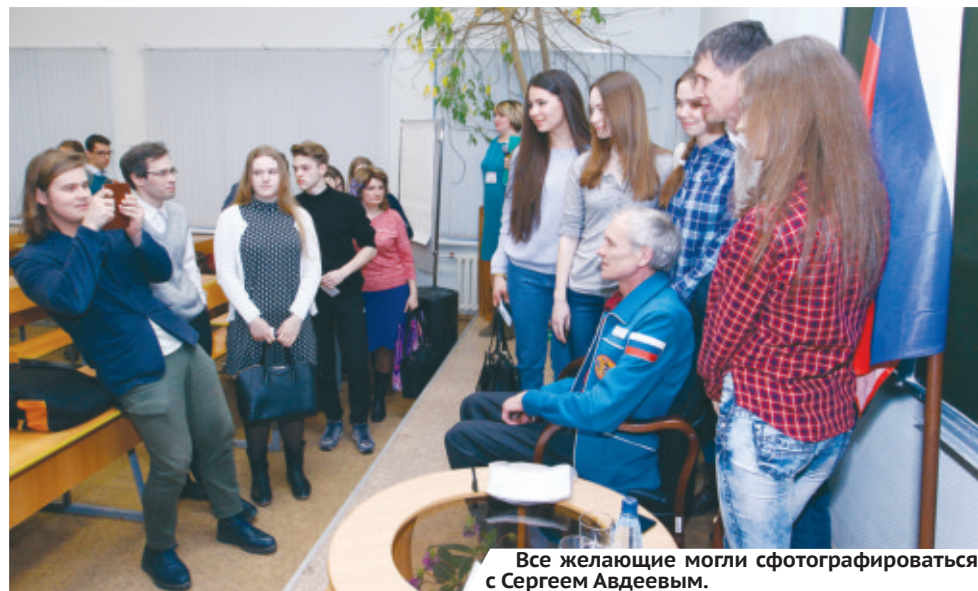
Все желающие могли сфотографироваться с Сергеем Авдеевым.

Стоит сказать, что встречи с известным космонавтом прошли также на базе миасского филиала элек-