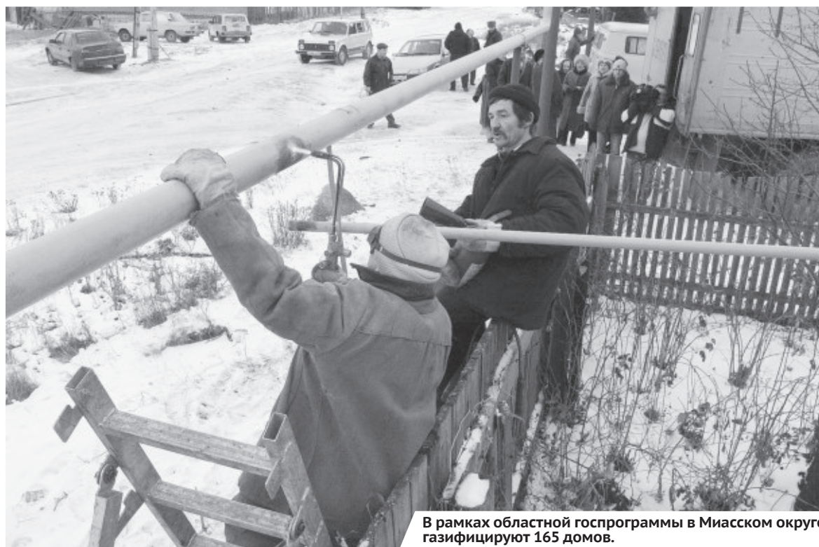
В рамках областной госпрограммы в Миасском округе газифицируют 165 домов.