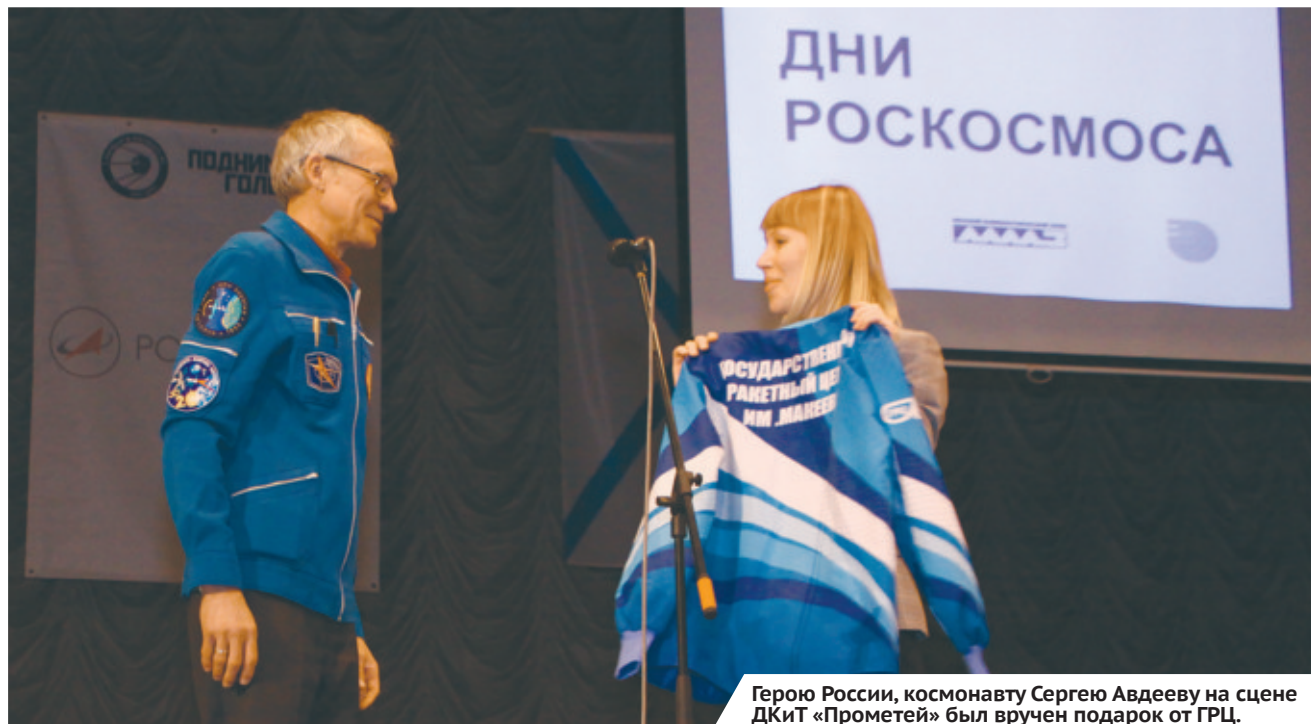
Герою России, космонавту Сергею Авдееву на сцене ДКиТ «Прометей» был вручен подарок от ГРЦ.

Сергей Васильевич не только рассказал школьникам о том, как он вы-