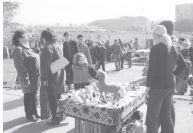
Бывший рынок в центре города.

Невелика библиотечная выставка, а удовольствие посетителям доставляет великое, свидетельство чему — многочисленные благодарности в книге отзывов. А что еще надо фотографу, который вновь почувствовал, что его искусство востребовано и нужно людям?..