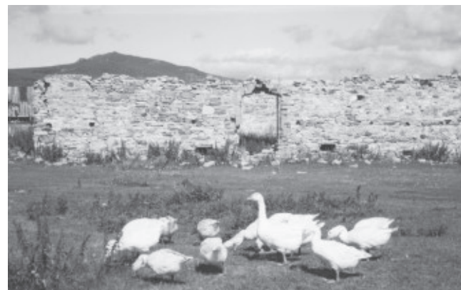
Гуси и лошади в с. Вознесеновка (Башкирия).