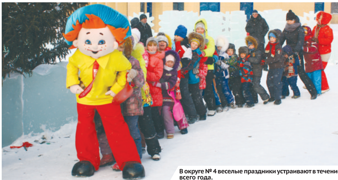
В округе № 4 веселые праздники устраивают в течение всего года.

В округе № 4 много молодых семей с маленькими детьми. На радость юным жителям округа силами депутата были смонтирова-