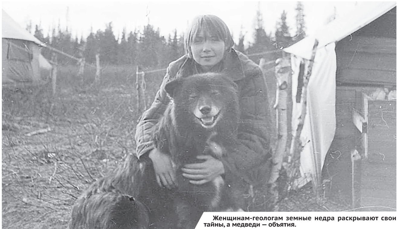
Женщинам-геологам земные недра раскрывают свои тайны, а медведи — объятия.

«18.08.81. Делали новый разрез внизу по течению. Камни — открытая книга. Читай, если сможешь. В них — история Урала».