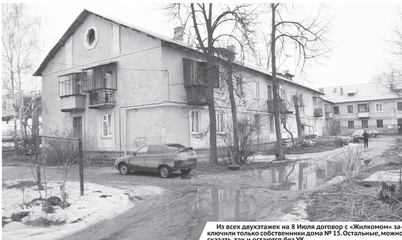
Из всех двухэтажек на 8 Июля договор с «Жилкомом» заключили только собственники дома № 15. Остальные, можно сказать, так и остаются без УК.

Тем не менее это никогда не заменит полноценное обслуживание. Осложняет ситуацию и то, что собственников в двухэтажках мало, а состояние фонда плачевное, поэтому и тариф на обслуживание такого