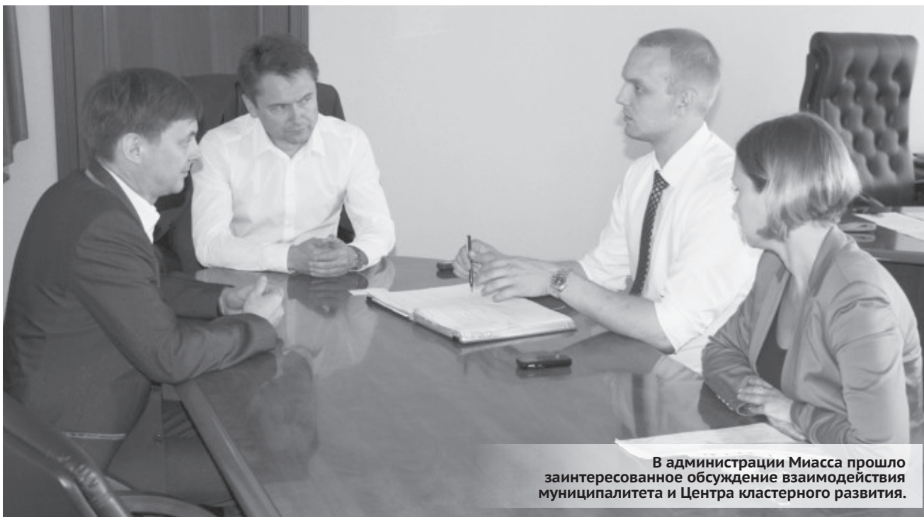
В администрации Миасса прошло заинтересованное обсуждение взаимодействия муниципалитета и Центра кластерного развития.