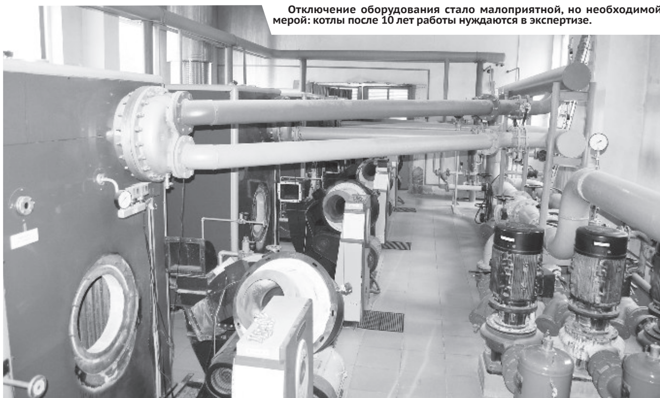
Отключение оборудования стало малоприятной, но необходимой мерой: котлы после 10 лет работы нуждаются в экспертизе.