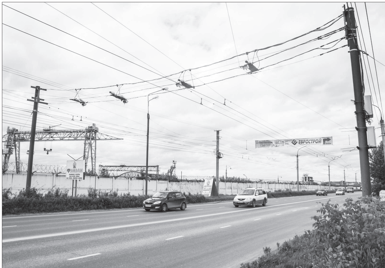
Планируется, что система «Безопасный город» пополнится еще 64-мя камерами.

В скором времени Миасс будет оборудован дополнительными камерами видеонаблюдения