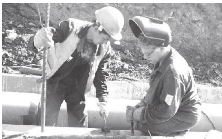
Вода в домах появилась, теперь самое главное — подготовить новую теплотрассу к гидравлическим испытаниям. Их начало намечено на 15 августа.