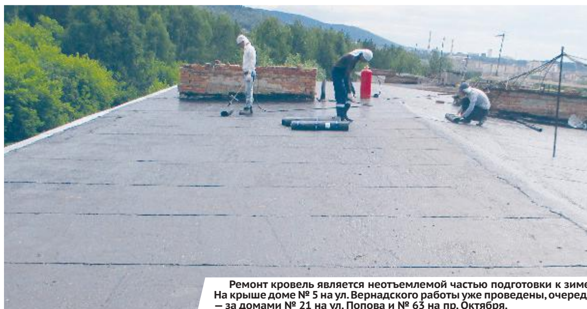
Ремонт кровель является неотъемлемой частью подготовки к зиме. На крыше дома № 5 на ул. Вернадского работы уже проведены, очередь — за домами № 21 на ул. Попова и № 63 на пр. Октября.

После этого управляющая компания начала плано-