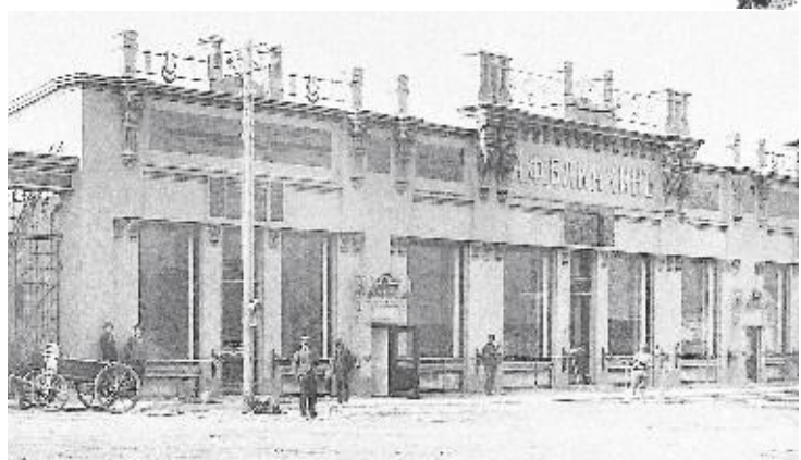
Дом купца Бакакина, нынче ГДК. Как говорится, найдите 10 отличий...