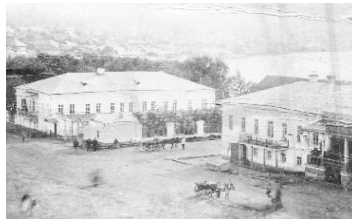
Сад, оранжерея, чугунные решетки, каменная набережная... Всего этого нет сегодня. Осталось лишь первое в городе здание из камня.

Говорят, что во время приездов в Миасс в 30-е годы XIX века в этом доме останавливался