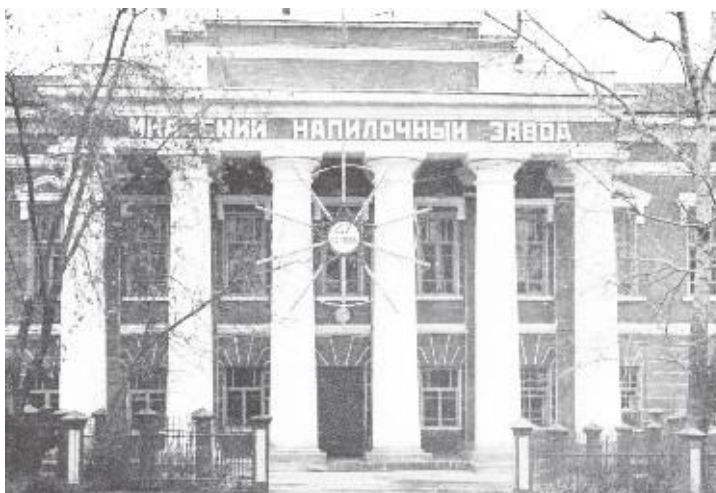
Здание с шестью колоннами когда-то было украшением Миасского завода.

Справа от площади Труда — контора заводоуправления, построенная (страшно произне-