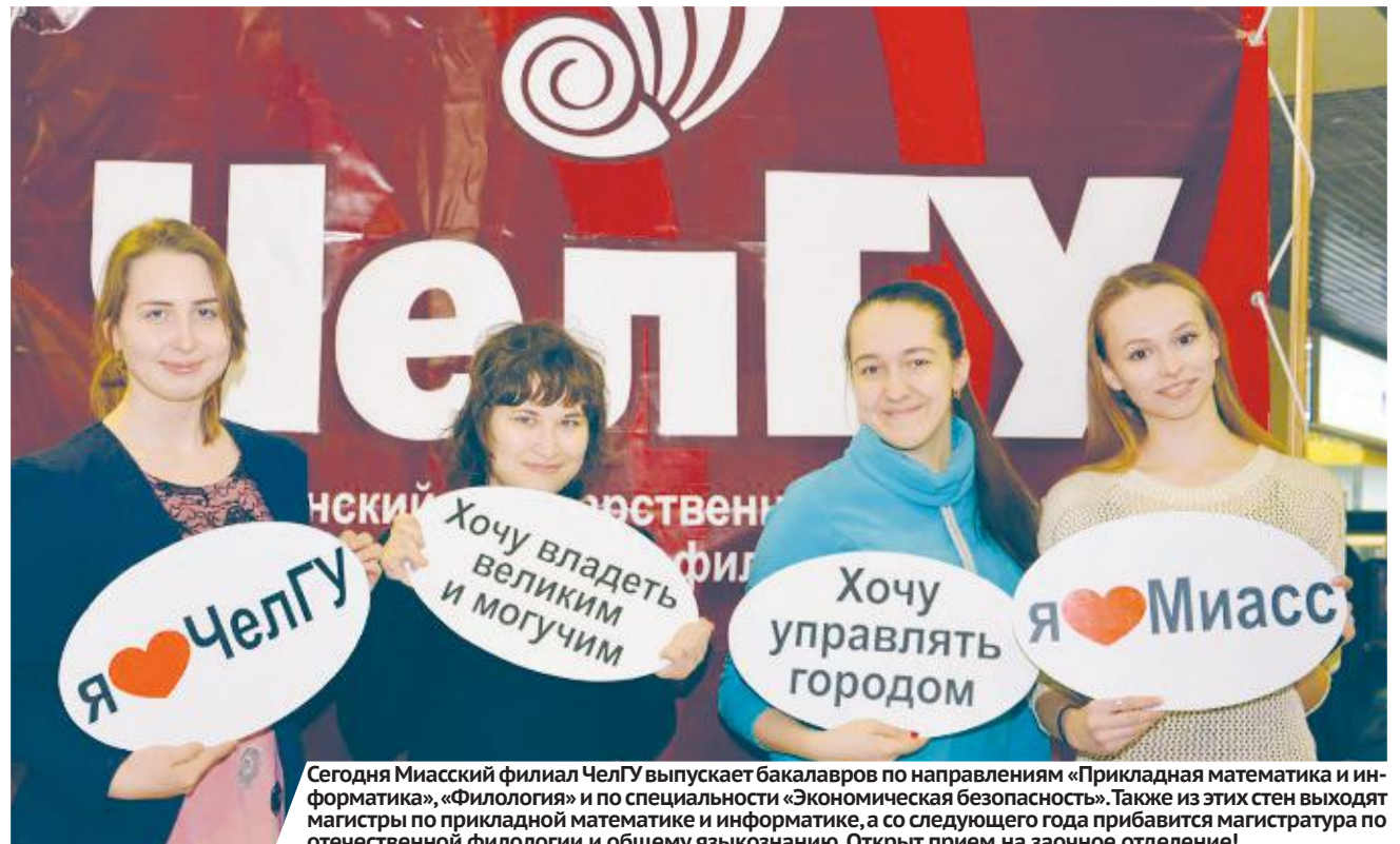
Сегодня Миасский филиал ЧелГУ выпускает бакалавров по направлениям «Прикладная математика и информатика», «Филология» и по специальности «Экономическая безопасность». Также из этих стен выходят магистры по прикладной математике и информатике, а со следующего года прибавится магистратура по отечественной филологии и общему языкознанию. Открыт прием на заочное отделение!

Годы идут, «эксперимент» продолжается, и, по мнению педагогов миасских школ и вузов, тема становится все более и более актуальной. Об этом мы сегодня беседуем с педагогами Миасского филиала ЧелГУ: благодаря своей подготовке и профессиональному опыту они являются экспертами в области как школьного, так и высшего образования.