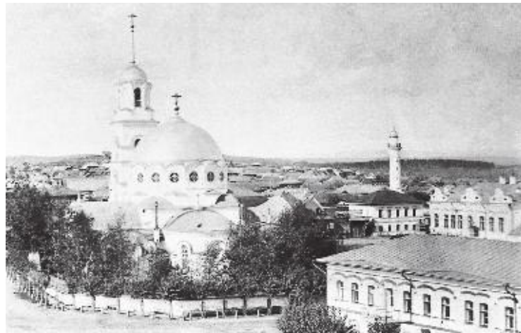
До 1936 года на площади Труда высился величественный Петропавловский собор.

В январе 1924 года на площади Труда заложили, а через год достроили памятник В. И. Ленину (точнее, бюст) на средства рабочих напильного завода.