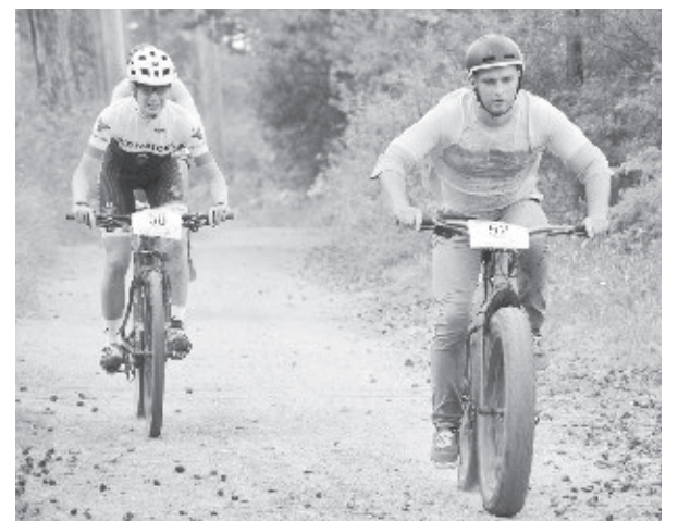
Фоторепортаж с веломарафона — на сайте Миасский рабочий.ру.

Победители в каждой возрастной группе были награждены призами от спонсоров, грамотами и медалями.