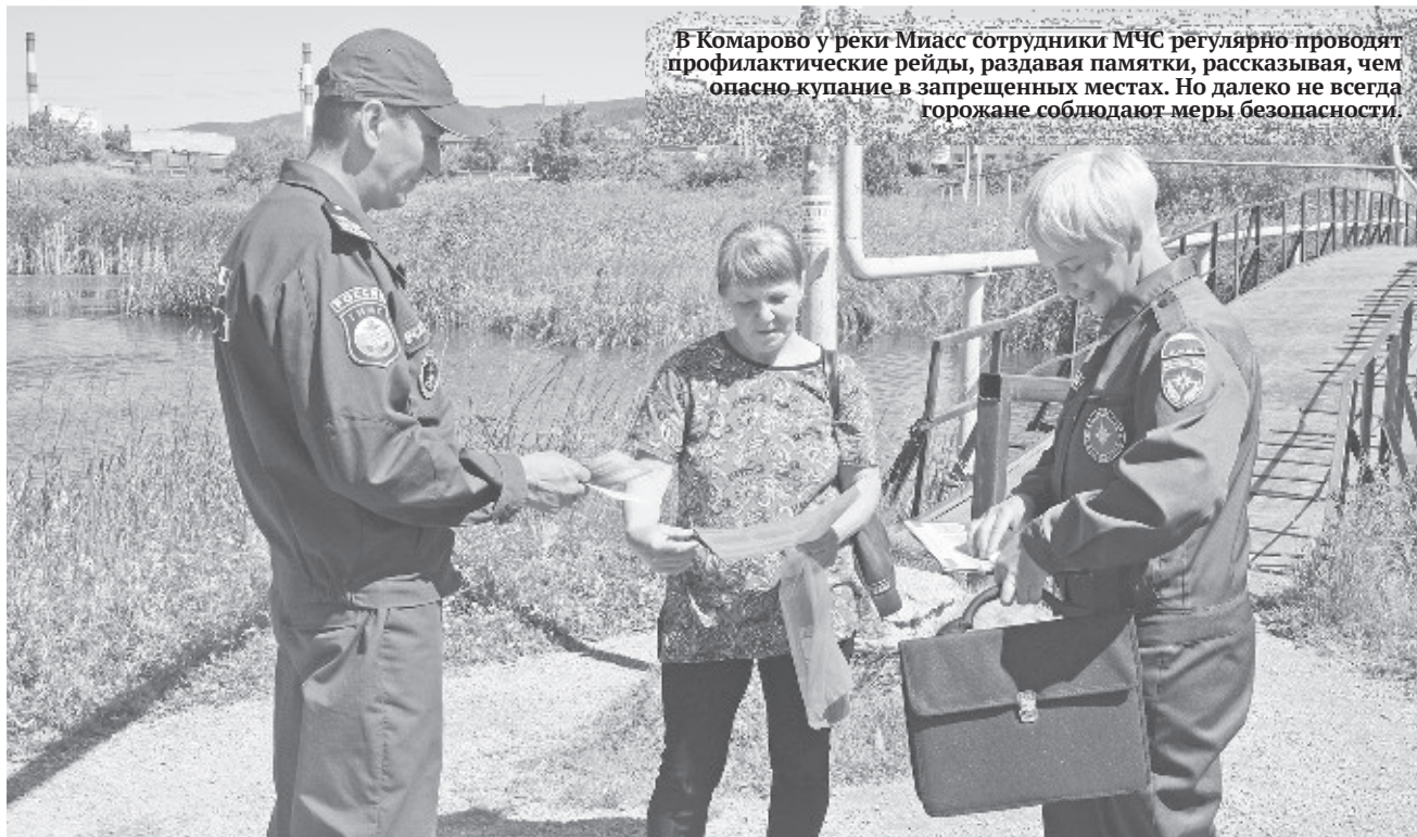
В Комарово у реки Миасс сотрудники МЧС регулярно проводят профилактические рейды, раздавая памятки, рассказывая, чем опасно купание в запрещенных местах. Но далеко не всегда горожане соблюдают меры безопасности.

В администрации предпринимают меры для предотвращения трагедий на воде, которых с начала сезона произошло уже пять