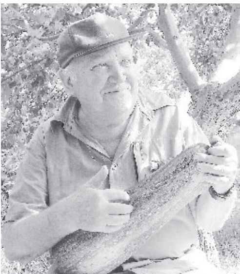
Хорошо поработали... —

— Мы здесь выросли и не мыслим себя без нашего сада. Какой курорт? Зачем?.. Здесь во сто крат лучше. Уже подросло четвертое поколение, и нам радостно видеть, что внуки и правнуки также полюбили сад, как любили его мы, будучи детьми.