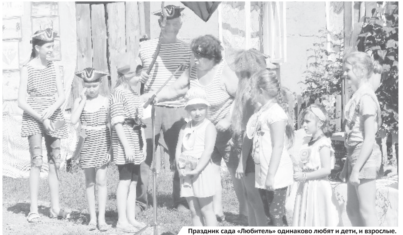
Праздник сада «Любитель» одинаково любят и дети, и взрослые.

И снова вопрос: во всех ли садах есть кедры?.. Вряд ли.