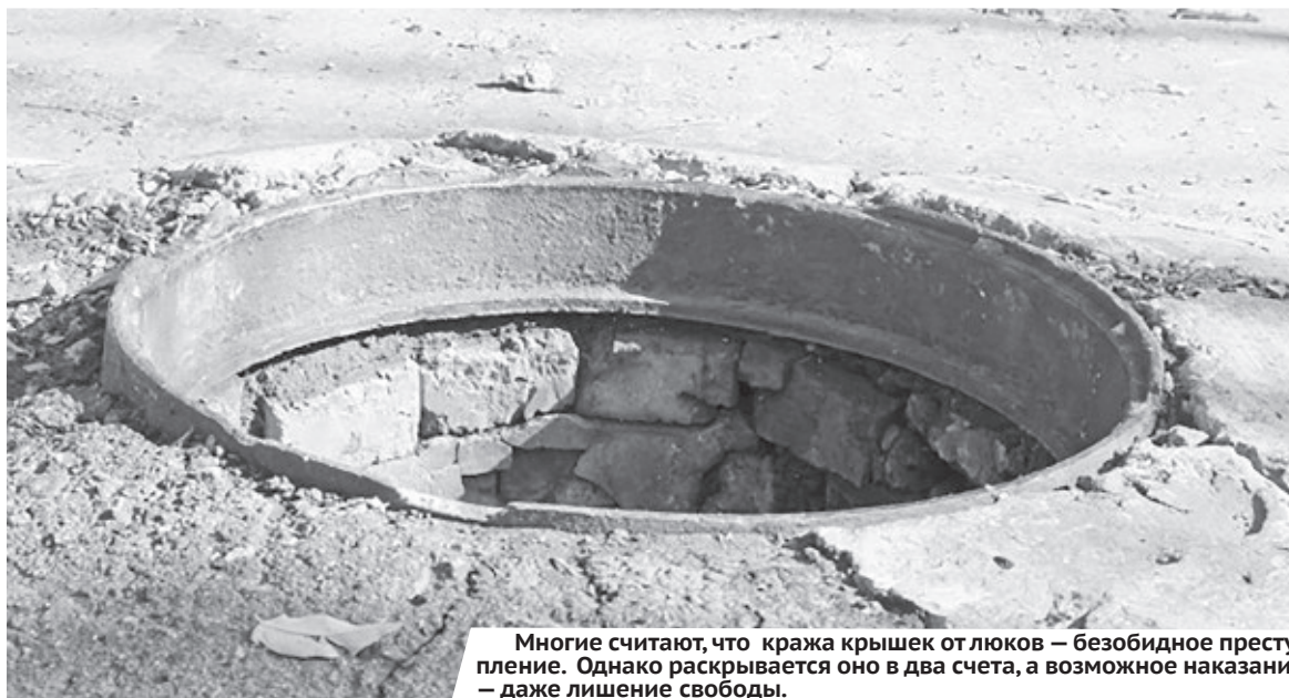
Многие считают, что кража крышек от люков — безобидное преступление. Однако раскрывается оно в два счета, а возможное наказание — даже лишение свободы.

Сезон садово-огородных и строительных работ в самом разгаре. Благо, этому способствует и погода. Всем известны таланты наших сограждан, которые готовы пустить в дело у себя на участке практически любой подручный материал. Исключением не являются и крышки колодцев. Нередко похищенные крышки люков сдают в металлолом.