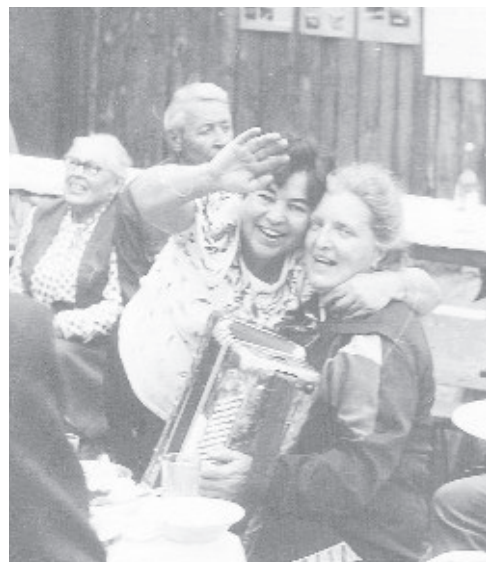
...хорошо отдохнули! В «Любителе» издавна каждый юбилей сада отмечают песнями, танцами, музыкой, инсценировками.