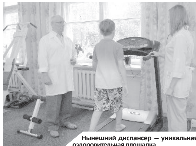
Нынешний диспансер — уникальная оздоровительная площадка.