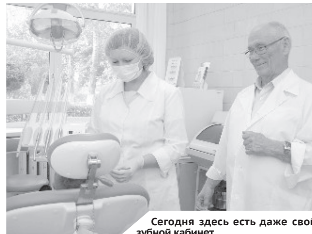
Сегодня здесь есть даже свой зубной кабинет.