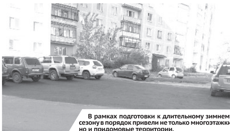
В рамках подготовки к длительному зимнему сезону в порядок привели не только многоэтажки, но и придомовые территории.