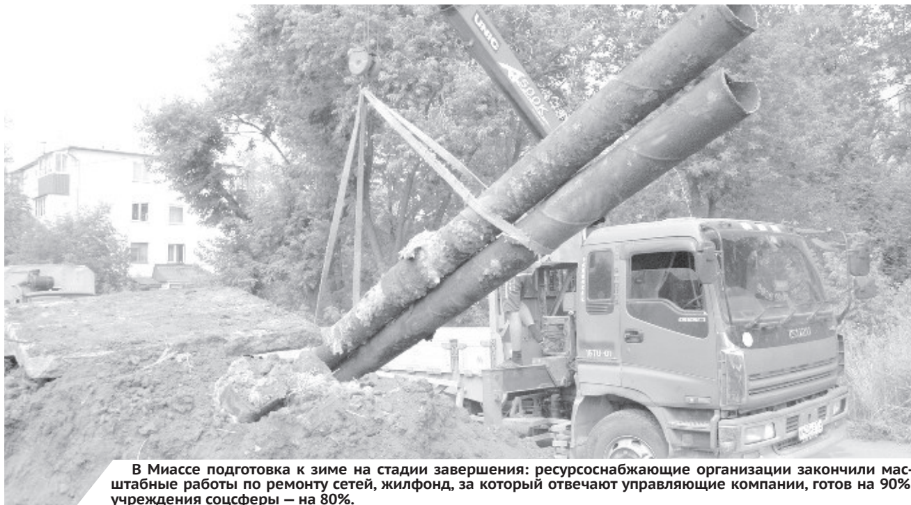
В Миассе подготовка к зиме на стадии завершения: ресурсоснабжающие организации закончили масштабные работы по ремонту сетей, жилфонд, за который отвечают управляющие компании, готов на 90%, учреждения соцсферы — на 80%.

В настоящий момент челябинский отдел Уральского управления Ростехнадзора проверяет теплоснабжающие организации. Проверки уже проведены в 20 муниципалитетах, замечания Ростехнадзора устраняются, органы местного самоуправления приступили к получению актов готовности объектов жилфонда и соцсферы. С 1 сентября муниципалитеты начали докладывать о количестве актов готовности объектов в еженедельном режиме.