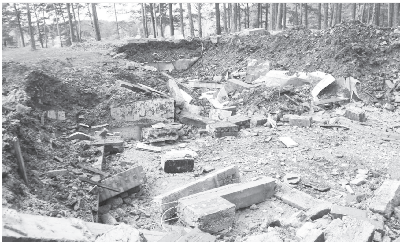
Работы по приведению участка в первоначальный вид должны завершиться до конца октября.

Вслед за прокуратурой города подключились и областные структуры. Так,