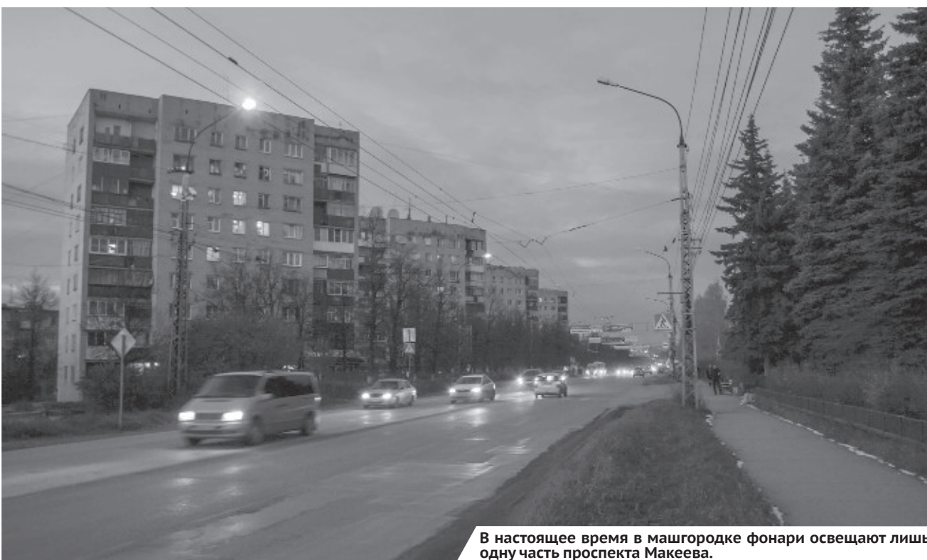
В настоящее время в мшгородке фонари освещают лишь одну часть проспекта Макеева.