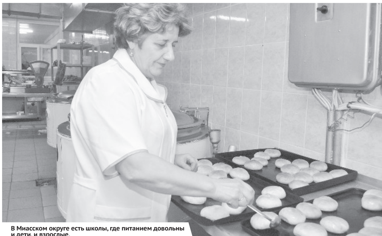
В Миасском округе есть школы, где питанием довольны и дети, и взрослые.