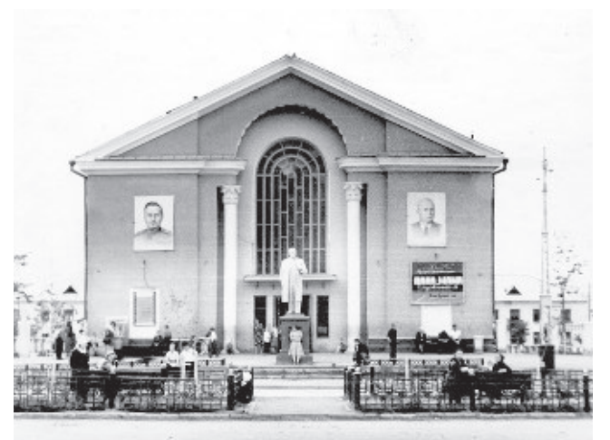
Из десятка миасских кинотеатров остались на сегодняшний день только «Энергия» и ДК «Горняк», но фильмы там давно не показывают.